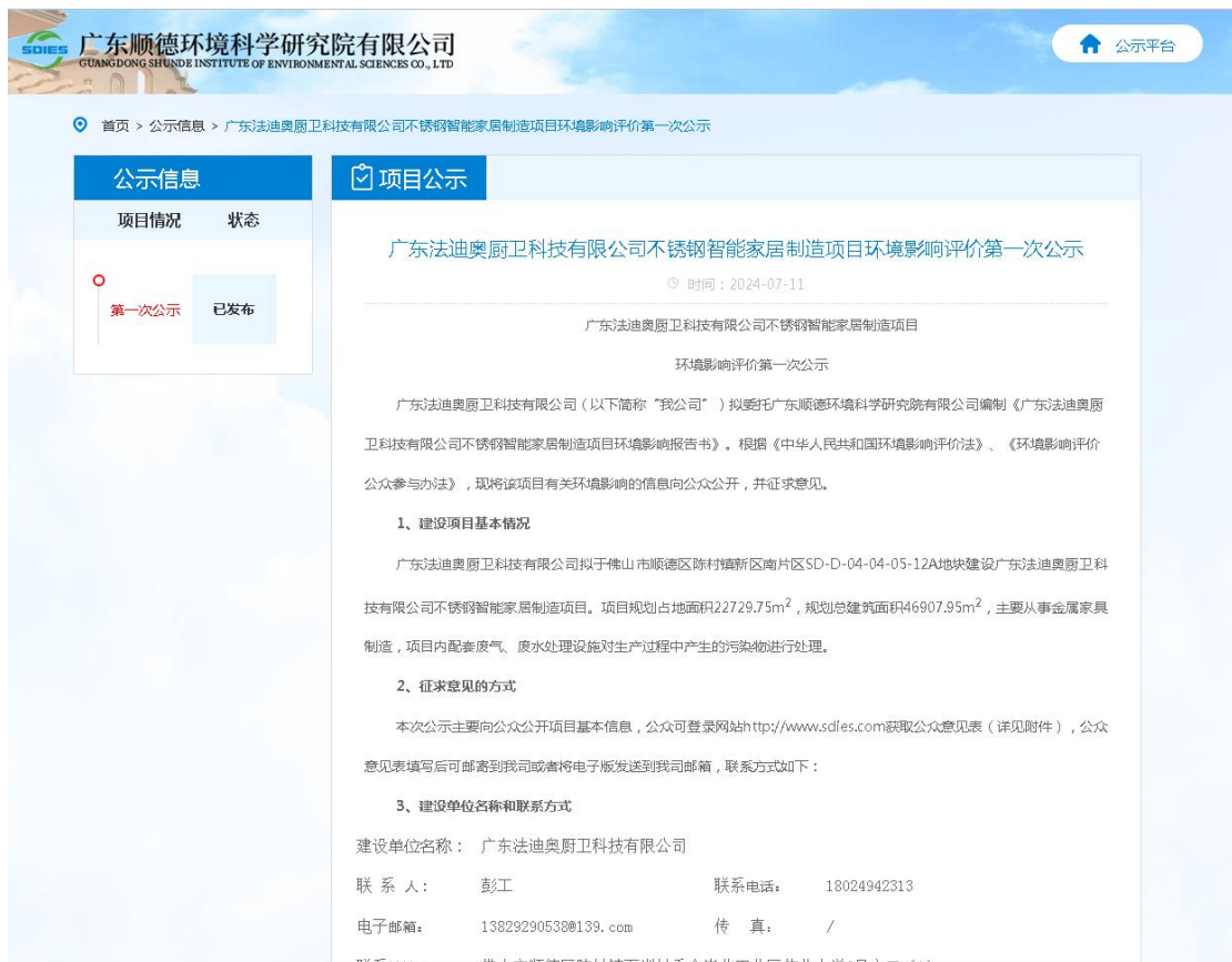
图 2-1 首次环境影响评价信息网络公示截图

建设单位于 2024 年 7 月 5 日在网络平台（ http://www.sdies.com/ ）进行了首次环境影响评价信息公开，公示截图如下图所示。