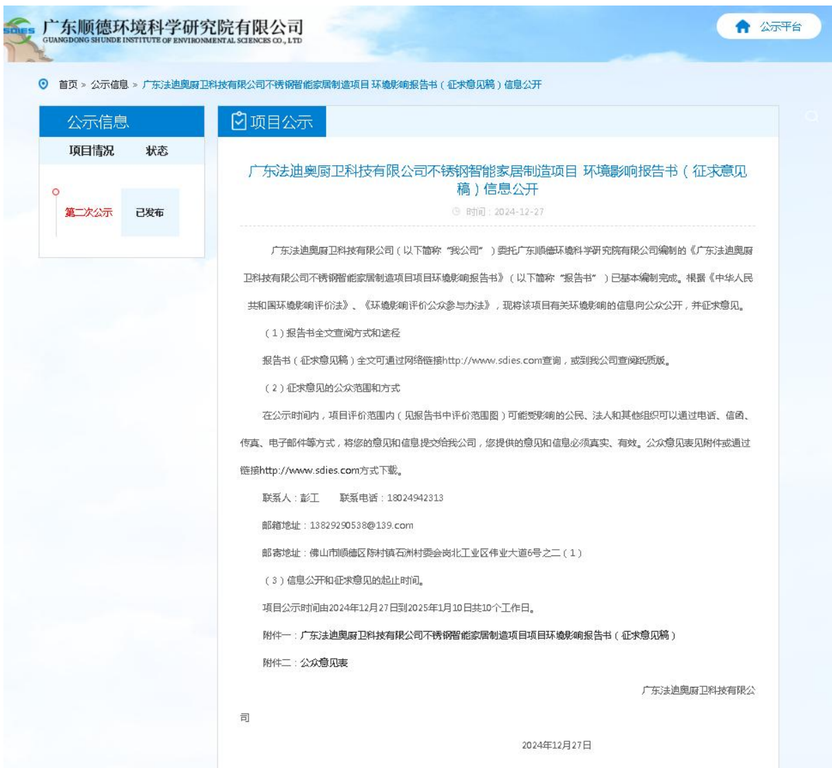
图 3-1 征求意见稿公示网络公示截图